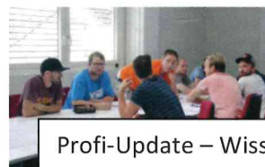
Profi-Update – Wissensaustausch