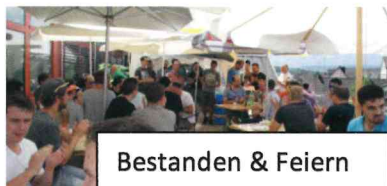
Bestanden & Feiern