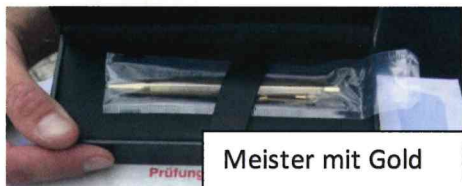
Meister mit Gold

Schon fast Tradition: der goldene Kugelschreiber hier für Bestnote von 5,3.