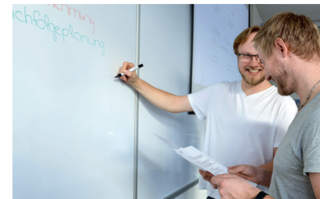
Aktives Lernen in kleinen Gruppen mit einem starken Bezug zur Praxis gehört ins Ausbildungskonzept.