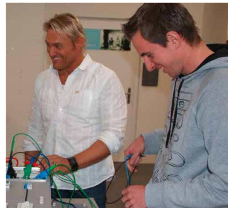
Lernen im Team – einer weiss es immer.