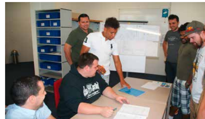
Elektro-Projektleiter im Wissensaustausch zu den eidg. Prüfungen.