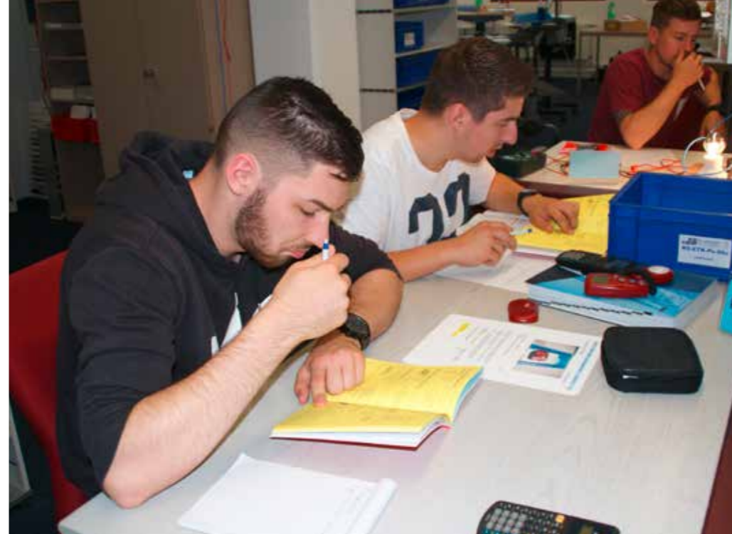
Parcours mit verschiedenen Lernstationen.