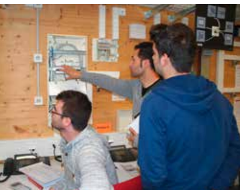
Das Eigenheim – direkt am Lernposten.

Die Digitalisierung spielt auch bei der Aus- und Weiterbildung eine immer wichtigere Rolle. Dozierende werden zwar noch nicht durch Roboter ersetzt – doch es ändert sich, wie und wo gelernt und mit welchen Hilfsmitteln dabei gearbeitet wird.